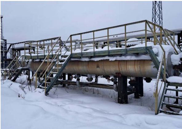
10.12 Пескоуловитель ПУ-2