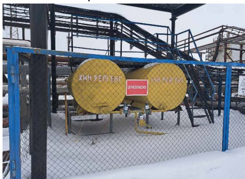
10.4 Емкость реагентного хозяйства - 2 шт