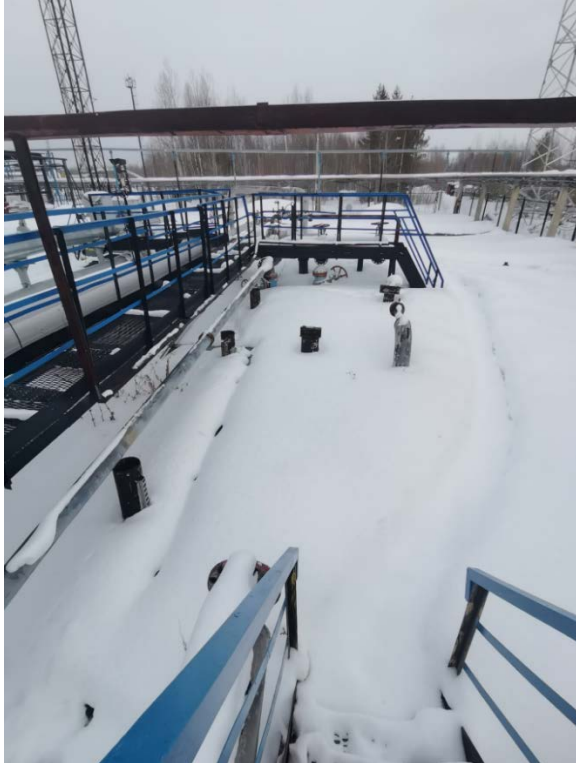
2.2 Технологические трубопроводы старого СИКНС (5)