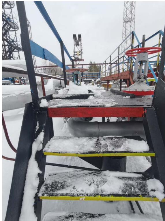
2.2 Технологические трубопроводы старого СИКНС (6)