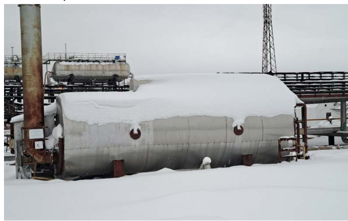
10.10 Нагреватель блочный на газовом топливе НГ-2