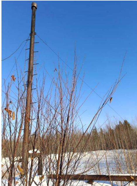
7.2 Факельная установка (старая) с газопроводом 219х6мм, L-500м (1)