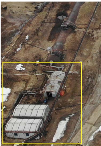
4.10 Насосные блоки 3 шт.