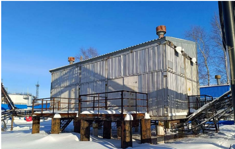
7.3 Здание КТПН