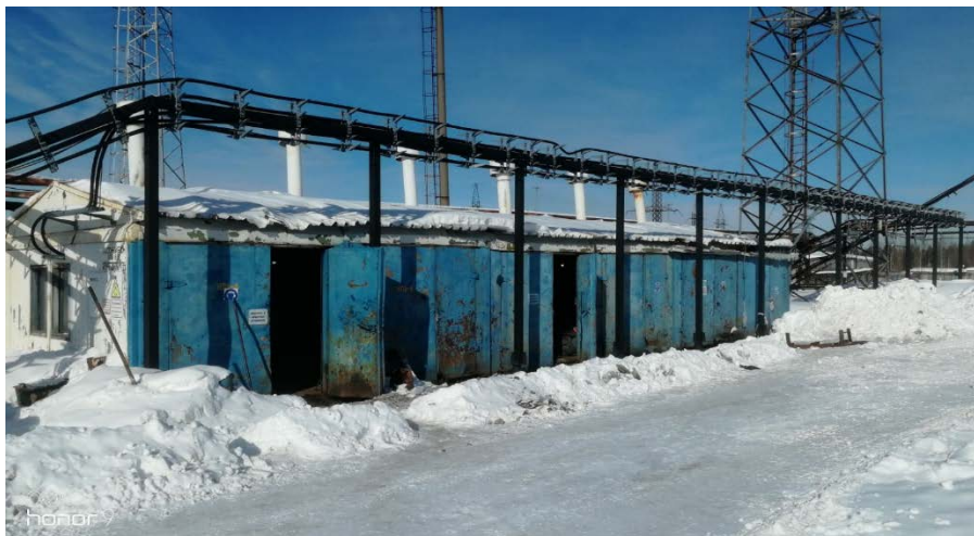
4.11 Блок НПВ 8-13