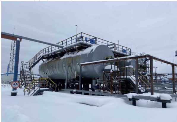
6.1-6.2 Буфер-сепаратор (1)