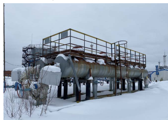
6.3-6.4 Пескоуловитель (1)