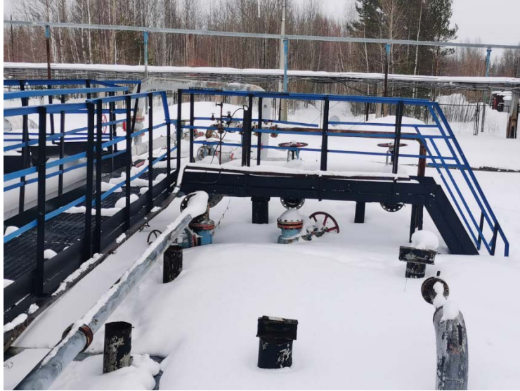
2.2 Технологические трубопроводы старого СИКНС (4)