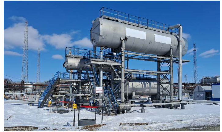
НГС-1, ГС-1, ГС-3