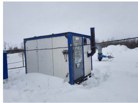
8.6 Блок дозирования реагента БДР-3