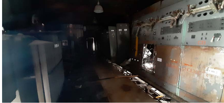
3.3 Блок ЩСУ