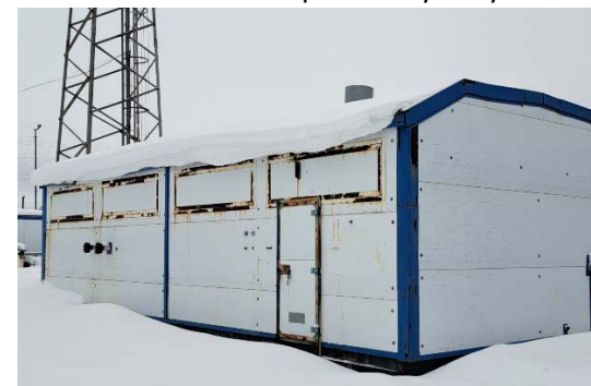
10.5 Блочный коммерческий узел учёта нефти