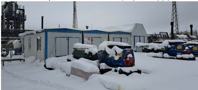
10.3 Блочная кустовая насосная станция (БКНС-1) (2)