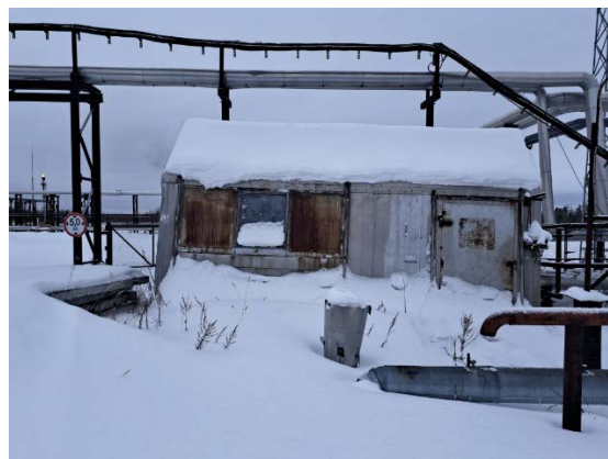
10.13 Арматурный блок №1