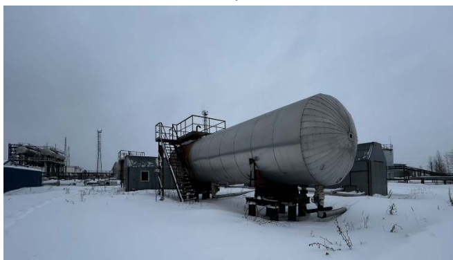
10.2 Емкость накопитель пресной воды, V=100м3