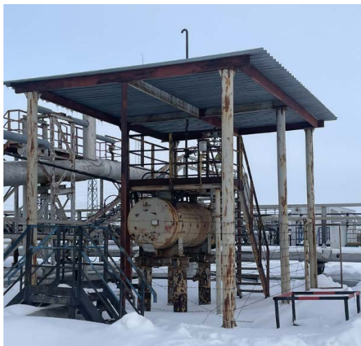
11.8 Металлоконструкции емкости хранения метанола