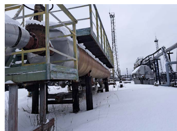
10.11 Пескоуловитель ПУ-1