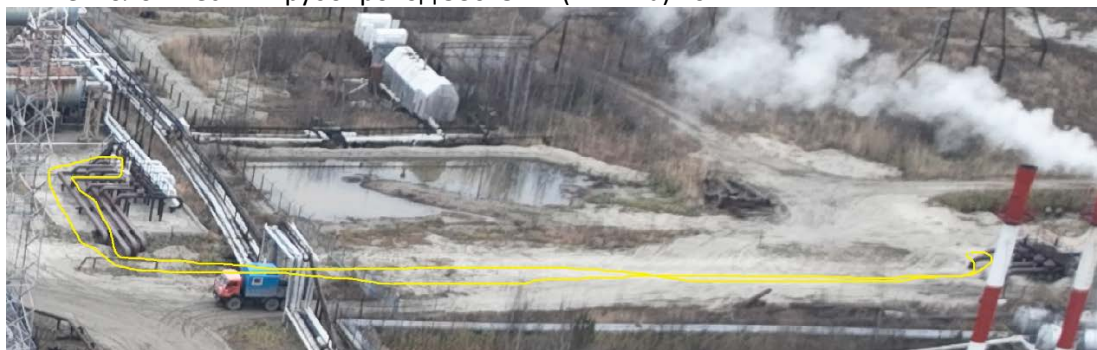
4.7 Технологический трубопровод 530х8мм (4 нитка) 70м.