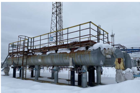
6.3-6.4 Пескоуловитель (2)