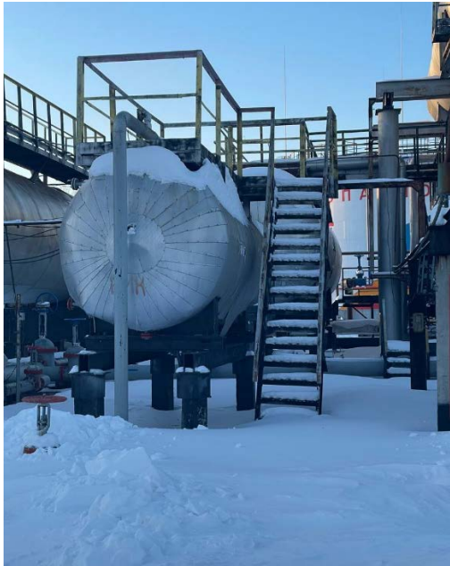
7.1 Емкость ингибитора коррозии V -16м3