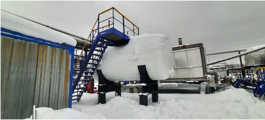
3.6 Трубопроводы УДР