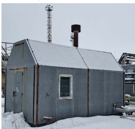
10.7 Станция обезжелезивания