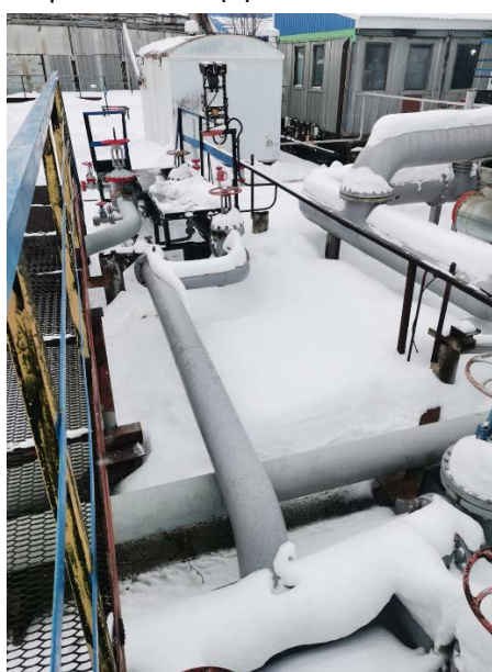
2.2 Технологические трубопроводы старого СИКНС (1)