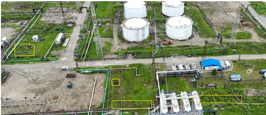
4.12 Несущие конструкции1