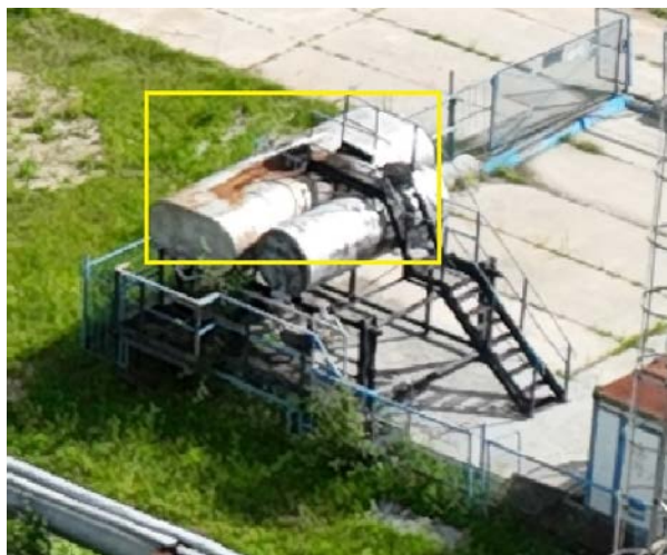
4.4 Емкость хранения деэмульгатора V-4м3