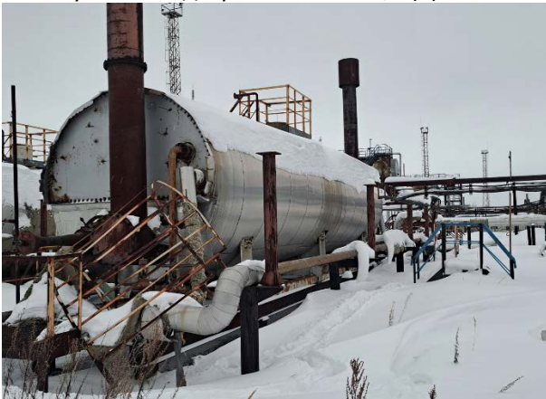
10.8 Путьовой подогреватель ПП-1,6 (3)