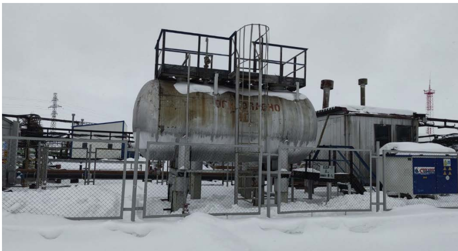
Аппарат емкостной V=25м3