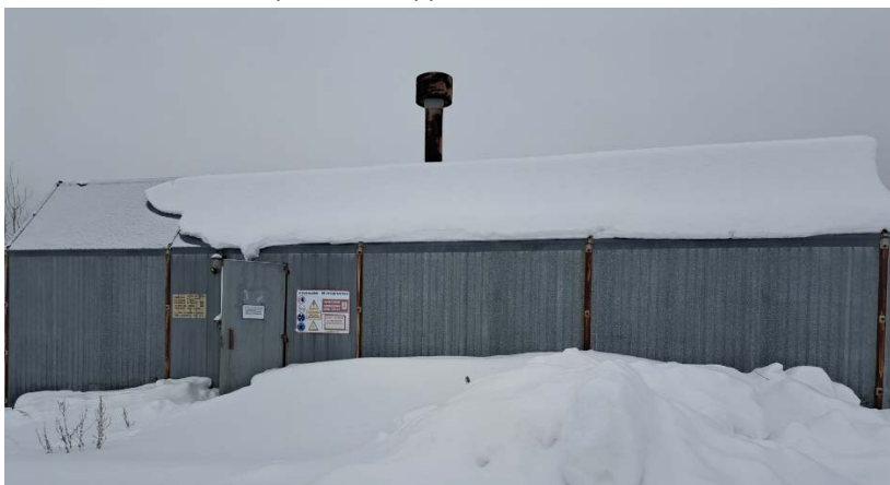
10.6 Насосная станция 2-го подъёма