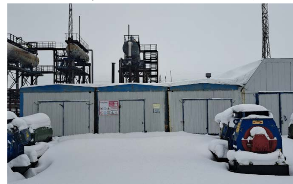
10.3 Блочная кустовая насосная станция (БКНС-1) (1)