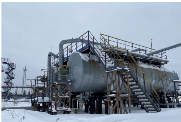
6.1-6.2 Буфер-сепаратор (2)