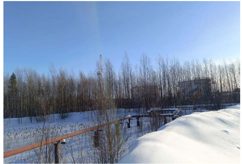
7.2 Факельная установка (старая) с газопроводом 219х6мм, L-500м (2)