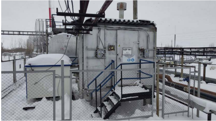
8.4 Блок дозирования реагента БДР-1