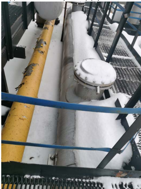
2.1 Устройство предварительного отделения газа (УПОГ) (2)