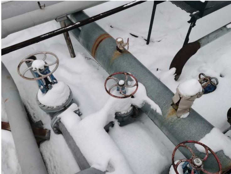
2.2 Технологические трубопроводы старого СИКНС (3)