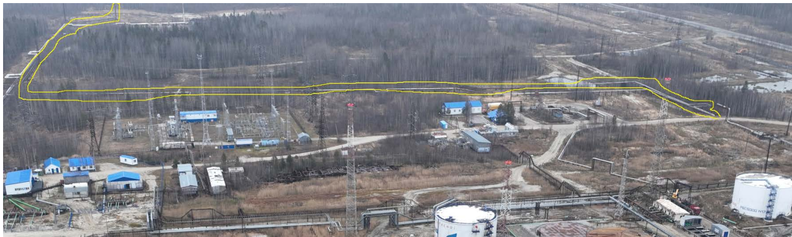
4.5 Газопровод на ФВД 530х6 820м