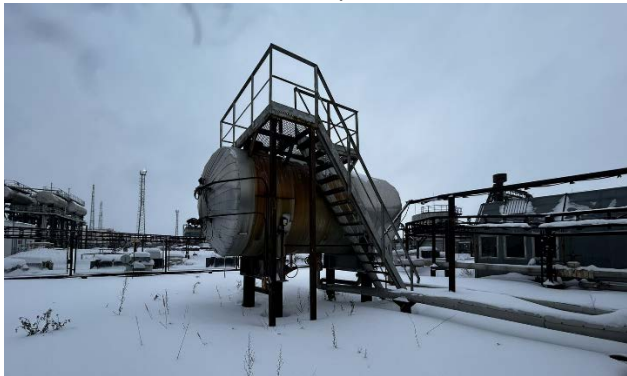
10.1 Емкость накопитель пресной воды, V=25м3