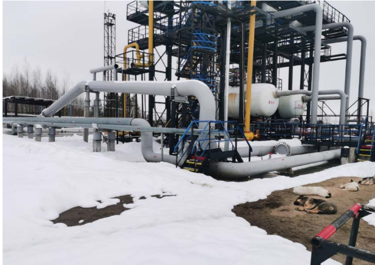
2.1 Устройство предварительного отделения газа (УПОГ) (4)