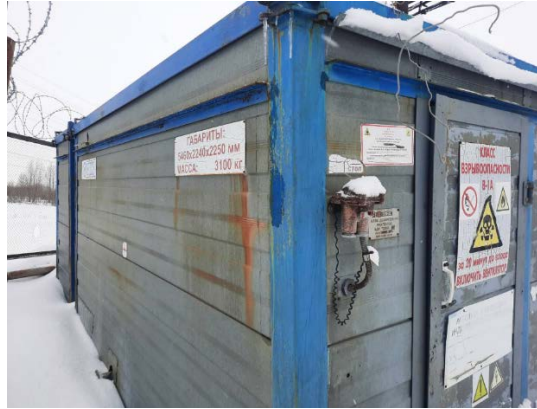
8.5 Блок дозирования реагента БДР-2