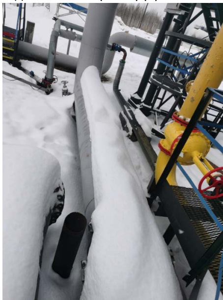
2.1 Устройство предварительного отделения газа (УПОГ) (3)