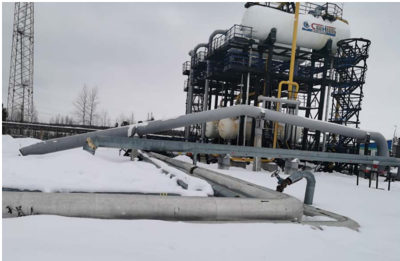
2.1 Устройство предварительного отделения газа (УПОГ) (1)