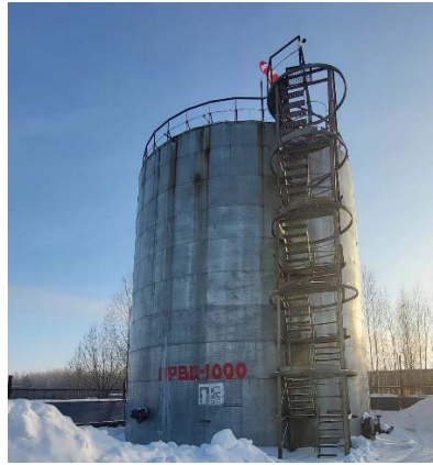
РВС для противопожарного запаса воды объемом 1000м3