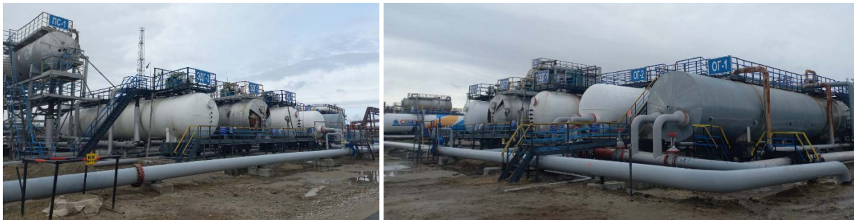
Электродегидратор ЭДГ -1,2,3 V-200м3