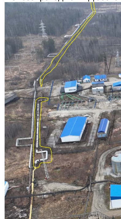
4.6 Газопровод на ФНД 530х6 820м